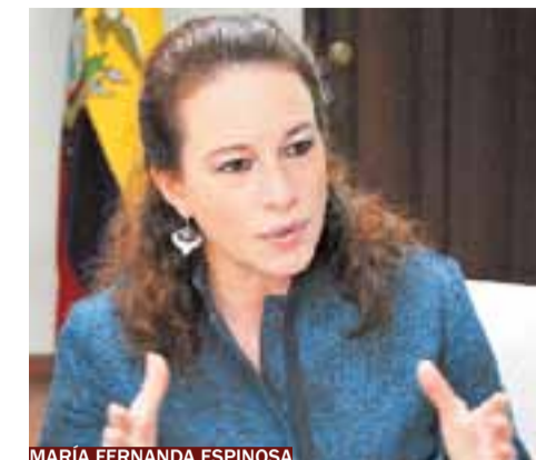
MARÍA FERNANDA ESPINOSA

“La pelota está ahora en nuestro tejado”, reconoce la ministra. Ecuador debe acordar con el PNUD el sistema de administración del fondo fiduciario, así como negociar bilateralmente con los países de la OPEP las aportaciones de cada uno de ellos. “El próximo paso es concretar el marco legal, puesto que no hay ningún antecedente”, observa Espinosa. Buena parte de los recursos del fideicomiso se destinarán al Plan Nacional de Cambio Climático: por una parte, para la prevención y la respuesta temprana a los desastres naturales; por otra, para fomentar del uso de las energías renovables. Además se trabaja en iniciativas como el Plan Socio Bosque, que prevé “incentivos económicos para que las comunidades campesinas no se vean abocadas a deforestar los bosques” y se puedan dedicar a actividades que no dañen el medio ambiente. Pero requerirán el apoyo de la comunidad internacional, porque “el cambio climático sólo puede combatirse desde una perspectiva planetaria”.